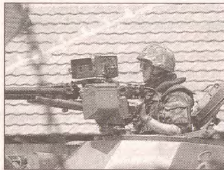
Takto byste vojáky sloužící u PTP vidět nemohli — sloužili bez zbraní