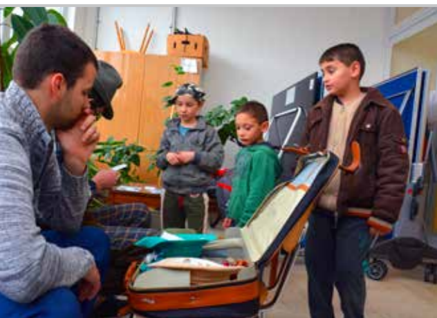
Stanoviště s kufrem připomnělo počátky Trochtovy práce s mládeží. Děti si z kufry vybíraly pomůcky pro krátká pantomimická vystoupení.

V sobotu 14. března se teplické sídliště Trnovany stalo dějištěm sportovního odpoledne pro děti a mládež s názvem „Po stopách Štěpána Trochty“. Účastníci se utkali ve vybraných disciplínách a ověřili si nejen svoji fyzickou kondici, ale také vlastní um a dovednosti. Odpoledního programu v Salesiánském středisku Štěpána Trochty na Luně se zúčastnilo několik desítek dětí včetně několika rodičů.