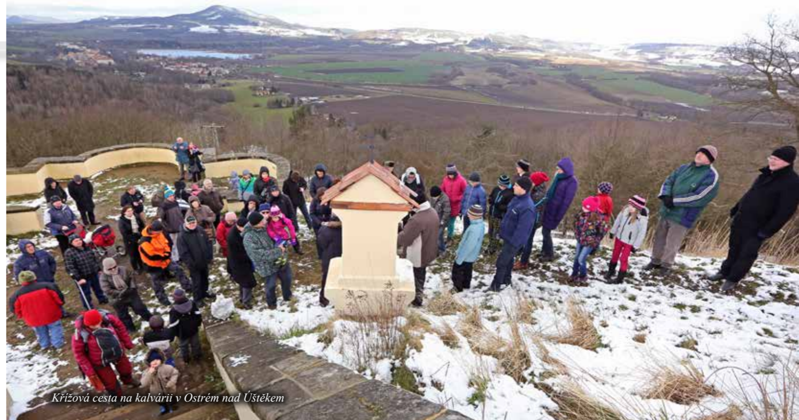
Křížová cesta na kalvárii v Ostrém nad Úštěkem