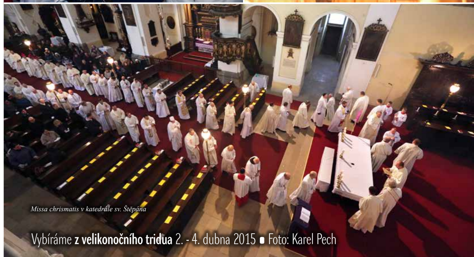
Missa chrismatis v katedrále sv. Štěpána

Vybíráme z velikonočního tridua 2. - 4. dubna 2015