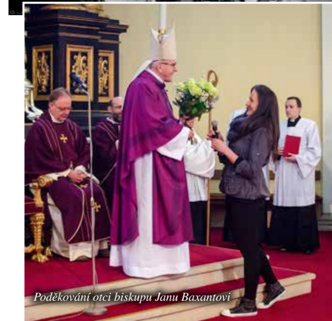
Poděkování otci biskupu Janu Baxantovi