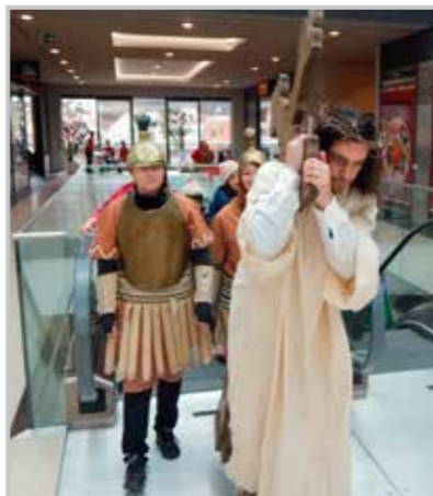
Hlavní postava netradiční křížové cesty vyjela mezi děti na eskalátoru.

ta od narození v Betlémě až po jeho smrt a tajemné vzkříšení, ve které věří křesťané,“ popsala soutěžní stanoviště ředitelka salesiánského střediska Vendulka Drobná.