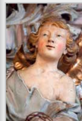
Fotografie na titulní straně časopisu: