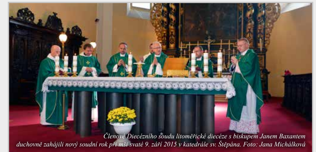
Členové Diecézního soudu litoměřické diecéze s biskupem Janem Baxantem duchovně zahájili nový soudní rok při mši svaté 9. září 2015 v katedrále sv. Štěpána.

Soud má své ze zákona povinné členy, kteří musí mít církevněprávní vzdělání – minimálně tzv. licenciát kanonického práva (akademický titul ve zkratce ICLic.) nebo doktorát z církevního práva.