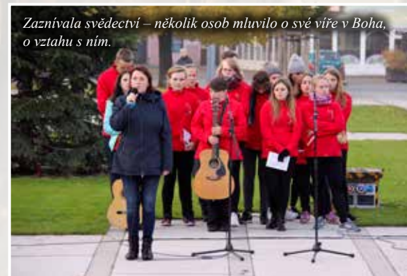
Zaznívala svědectví – několik osob mluvilo o své víře v Boha, o vztahu s ním.