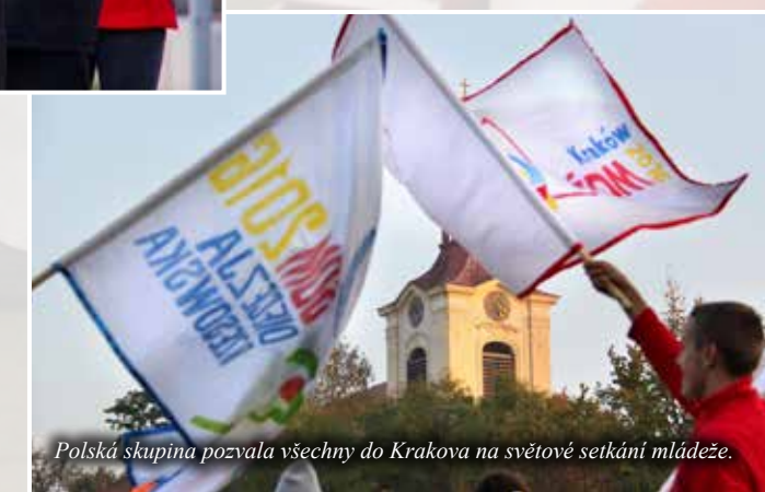
Polská skupina pozvala všechny do Krakova na světové setkání mládeže.