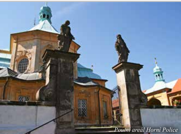
Poutní areál Horní Police