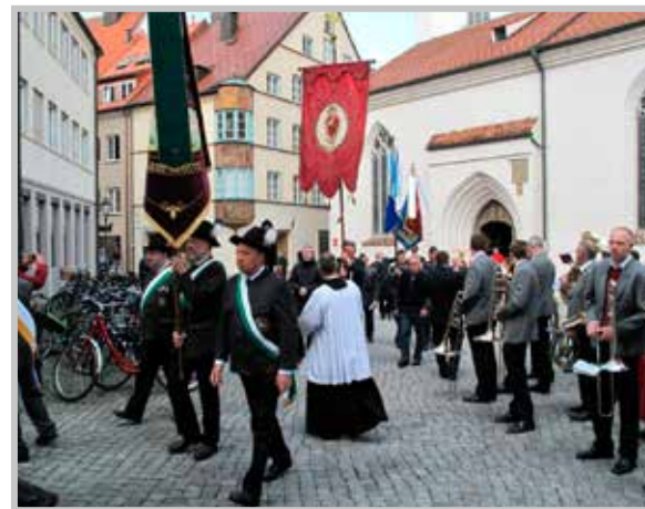
Procesí na slavnost sv. Krescencie je svátkem pro celé město a jeho četné spolky a hudebníky. Společný průvod (procesí) je výmluvným a oblíbeným symbolem společenství: lidé různých stavů, povolání a věku jdou jako jedna skupina za společným cílem.

jektu. Jsou na něm zpodobněny sv. Anna a sv. Krescencie, patronky obou měst, a také městské veduty.