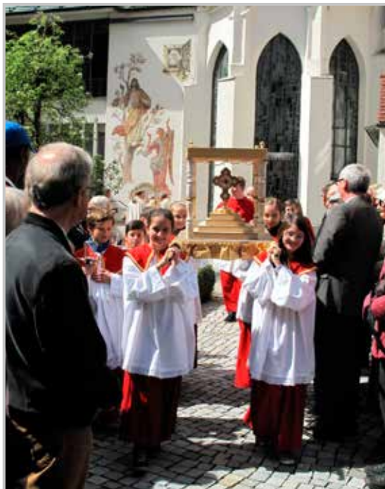
Průvod s relikviářem sv. Krescencie v klášterním dvoře. Klášter vznikl na místě původního jádra města, v tzv. Maierhofu.

V letošním roce si připomínáme kulaté výročí konce války. V dějinách Jablonce její konec vedl ve svých důsledcích ke vzniku „zrcadlového města“, městské části Neugablonz (ve městě Kaufbeuren v Bavorsku). Toto největší soustředění vyhnanců z jedné oblasti je fenomén evropského rozměru, vzniklý na hospodářském a kulturním základě díky úspěšnému znovuvybudování sklářského a bižuterního průmyslu v novém prostředí. V Neugablonz je nejviditelnější a nejvýše položenou budovou kostel Nejsvětějšího Srdce Ježíšova, tedy se stejným zasvěcením jako původní farní kostel v Jablonci, jen o 25 let mladší. Právě v něm slavili koncem letošního dubna oba faráři se svými farníky první společnou bohoslužbu v historii.