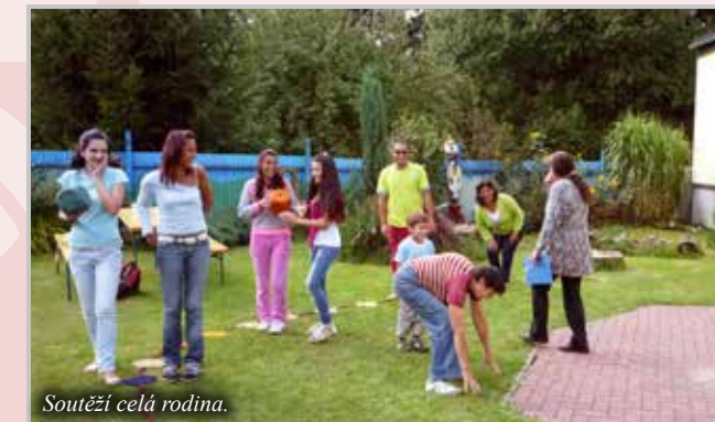
Soutěží celá rodina.