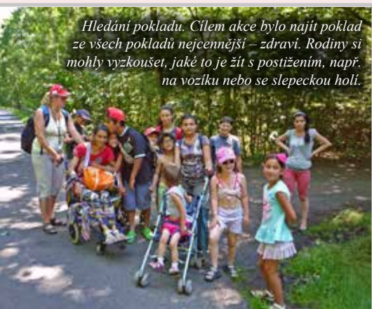
Hledání pokladu. Cílem akce bylo najít poklad ze všech pokladů nejcennější – zdraví. Rodiny si mohly vyzkoušet, jaké to je žít s postižením, např. na vozíku nebo se slepečkou holí.