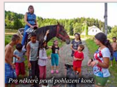
Pro některé první pohlazení koně.

služby. Jedním z úkolů je každoročně příprava vánočního cukroví pro všechny. Vzpomínám si na reakci jedné matky, které jsme s nadšením řekli, že má od nás k dispozici veškeré suroviny a vybavenou kuchyň a může začít péct. Reagovala slovy: „A to mám jako udělat sama cukroví a pro tolik lidí? Vždyť já nepeču ani doma!“ Nezbývalo než asistovat při výrobě cukroví od začátku až do konce. Maminky se učí pracovat s rozpisem receptu, vážením na vahách, zpracováním těsta až po