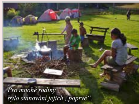
Pro mnohé rodiny bylo stanování jejich „poprvé“.

Vedle základních technik, které používáme při práci v klientově domácím prostředí, se často inspirováme také specifickými technikami, kterými jsou modelové situace, hraní rolí, užití příběhů a příkladů a domácí úkoly. Modelové situace představují pro klienta určité chování, které si má osvojit. Pracovník učí na názorném příkladu, jak si má klient počínat například při vstupním pohovoru, jak jednat