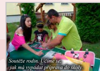
Soutěže rodin. Učíme se, jak má vypadat příprava do školy.

Asistenční službu pro rodiny s dětmi poskytuje rumburská Charita již od roku 2001, proto takovéhoto úsměvných a nezapomenutelných „poprvé“ má v pomyslném deníčku zapsáno pěknou řádku. Jistě mi dáte za pravdu, že reakce dětí jsou v žebříčku oblíbenosti na prvním místě a není tomu jinak ani u nás.