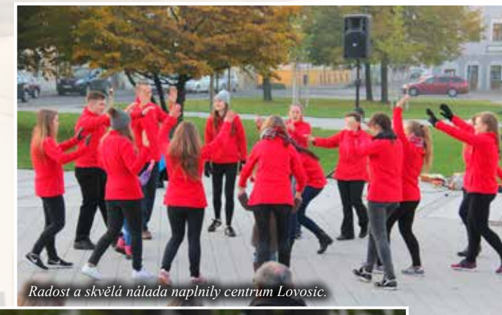
Radost a skvělá nálada naplnily centrum Lovosic.