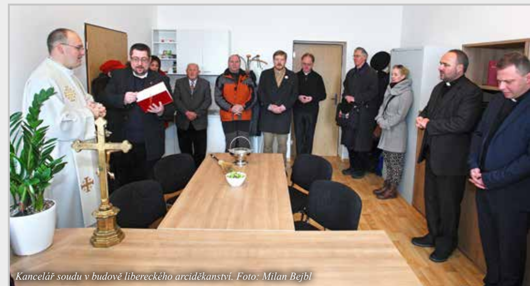
Kancelář soudu v budově libereckého arciděkanství.