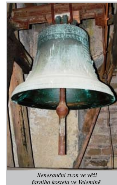
Renesanční zvon ve věži farního kostela ve Velemině.

Posledním cílem naší cesty při rozhlasovém natáčení byla věž farního kostela ve Velemině. Zde zatím všechno na obnovu či restaurování teprve čeká. Ve věži je zavěšen jeden nádherný renesanční zvon. Podle některých znaků opatrně usuzuji, že by mohl být dílem mistra Brikcího z Cymperka. Jisté znečištění zvonů a ne zrovna bezpečně vyhlížející místa, kam bylo možno šlápnout, to vše mě poněkud odradilo od akrobatických výkonů při lezení po zvonové stolici ve snaze přečíst nápis na zvonu ukrytý pod vrstvou holubích exkrementů, které by bylo třeba nejprve odstranit. V tuto chvíli tak musím konstatovat, že zvon byl odlitý „nezjištěným zvonařem“ (dodávám, že zatím nezjištěným, protože veleminskému zvonu bude muset být věnována samostatná dokumentační výprava).