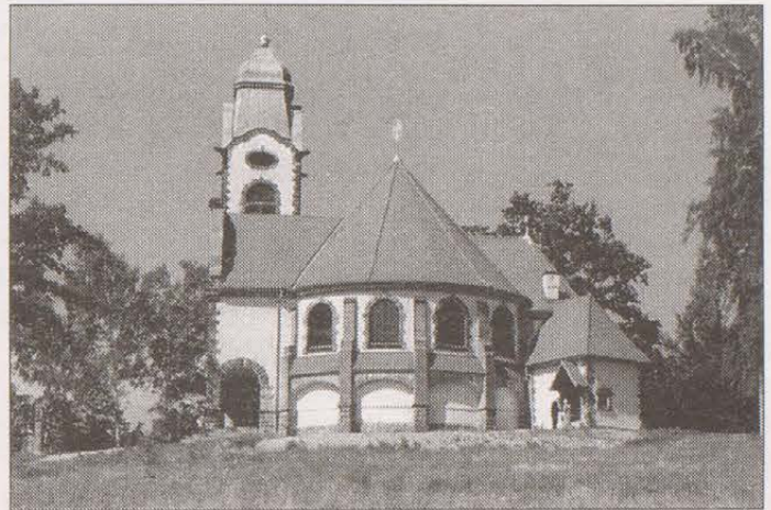
Typický pohled na „Římsko-katolický jubilejní kostel U Obrázku“