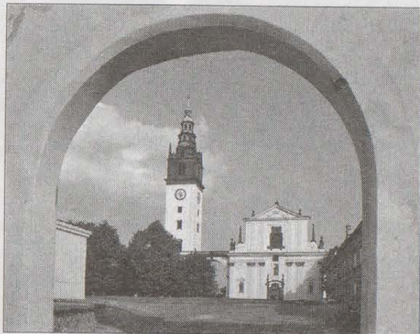
Katedrála sv. Štěpána před večerní slavnostní mší k výročí posvěcení katedrály.