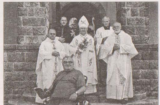
Společná fotografie převážně duchovních z hlavní česko-německé pouti 7. 9. 2003