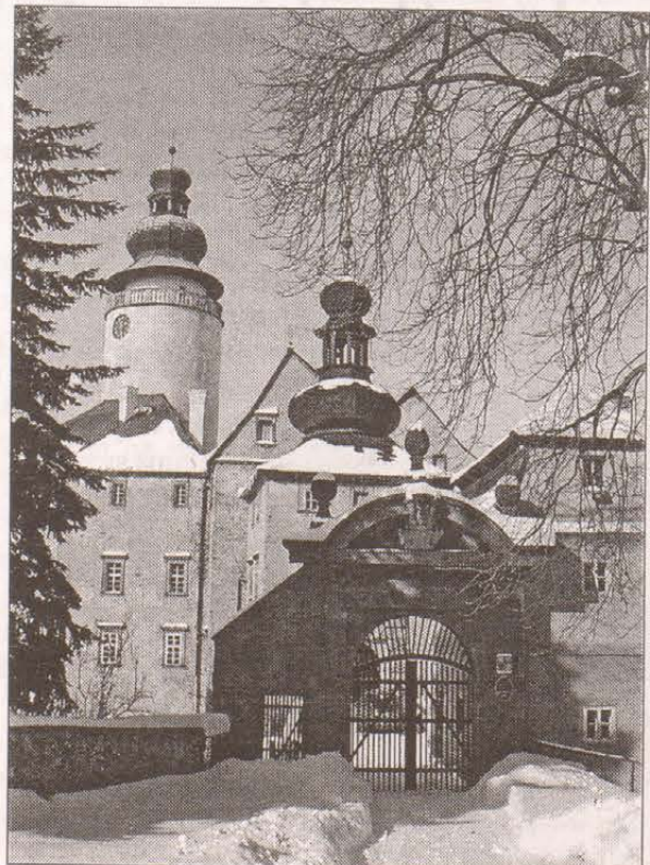
Fotografarar: Tempelrk Tajenka: Křířovka, Teer: 1D 5B 3C 4B 2D 0B