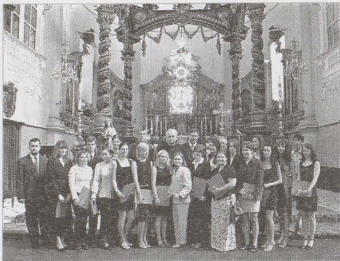
Předávání maturitních vysvědčení v bohosudovském gymnáziu se koná pravidelně v sousední bazilice Panny Marie Bolestné.

P. Rabušic k slušnému zacházení. Ale i vzácné kodexy a celý Migne mizely korytem z okna na těžká nákladní auta. Kdo se této práce odmítl účastnit, byl ihned odeslán do pracovního tábora do Želiva. Staří profesori, důstojní kmeti, vázali pak uzlíky na gumičkách do tepláků, mladí chodili do Elektroporcelánu čistit výlisky před vypalováním.