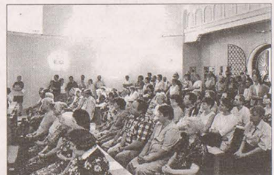
Hojná účast věřících (na fotografii oslava 95. výročí posvěcení kostela v roce 2002) není ojedinělá, poutní mše se konají v sezóně každý měsíc.