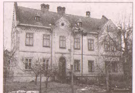
Fara v Přepěřích u Turnova