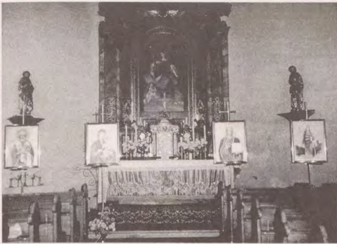
Interiér kostela sv. Barbory v Chomutově