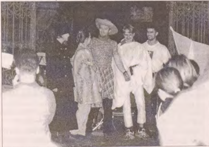
Záběr z jedné ze scének

U tohoto setkání bych rád ocenil celý páteční program, zvláště ale lampiónový průvod, který byl nejen pěkným zážitkem, ale i formou svědectví o naší víře. Dobré bylo také letné seznámení s klášterním životem, které probíhalo vlastně po celou dobu naší přítomnosti v Oseku. Určitě bylo přínosem, že otec biskup byl přítomen na setkání po celou dobu sobotního programu. Čas strávený s mládeží bude jistě záročen do budoucna důvěrou mládeže